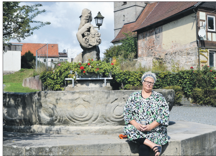
Gerne gönnt sich die „Retl“ eine kleine Auszeit bei der Wally in Weißenbrunn. Kaffee und ein kleines Pläuschen geben ihr einen guten Start in den Tag.

Die gläubige optimistische Frohnatur möchte den Menschen zur Seite stehn und vermitteln, dass wir die Hoffnung niemals aufgeben dürfen.